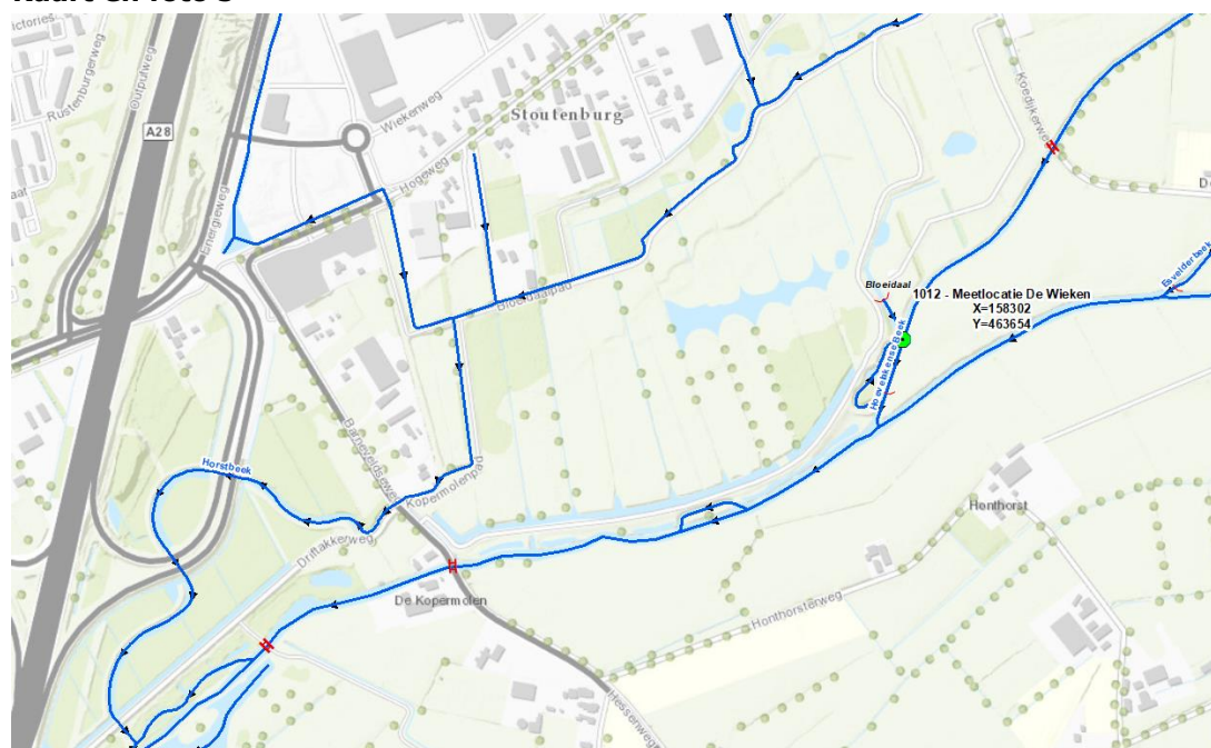
Figuur 1: Overzichtsk kaart.