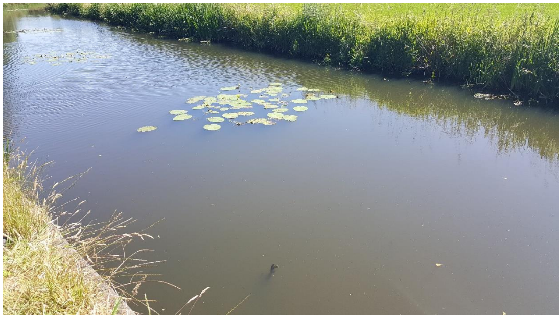
Figuur 3: Foto locatie tijdens veldbezoek op 27 juni 2019.