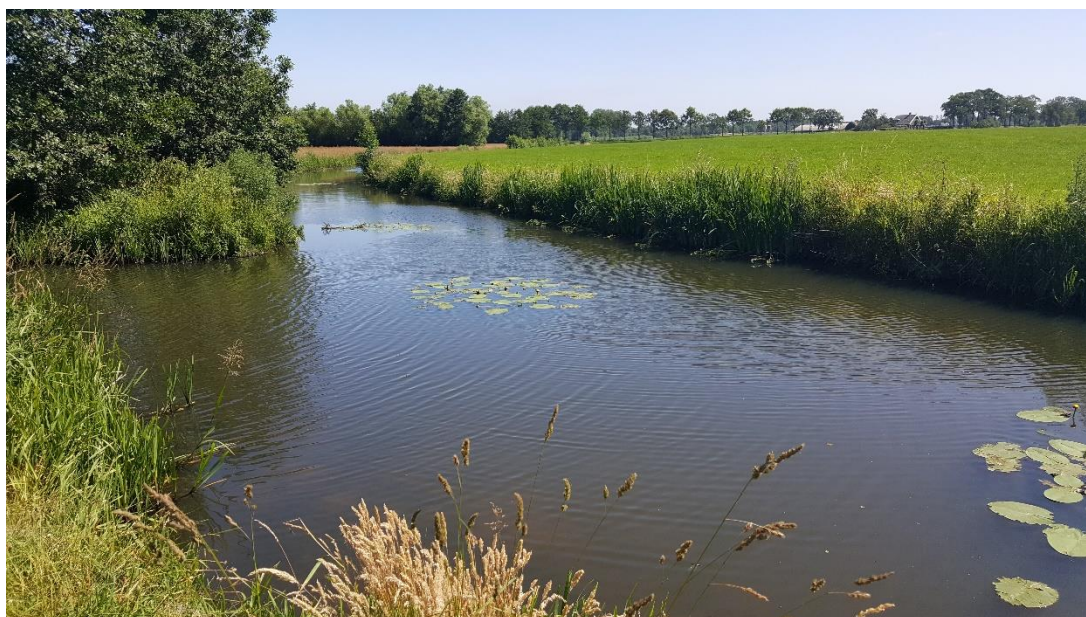
Figuur 4: Foto locatie tijdens veldbezoek op 27 juni 2019 (bovenstroomse zijde).