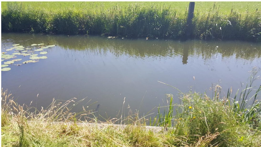
Figuur 2: Foto locatie tijdens veldbezoek op 27 juni 2019.